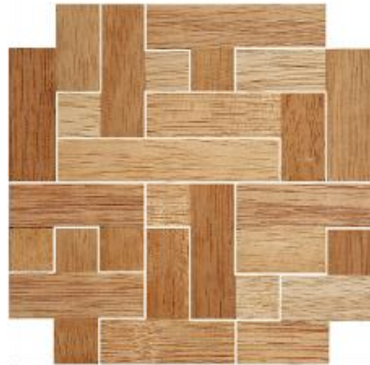
Fig. 78 www.creagenios.com.mx