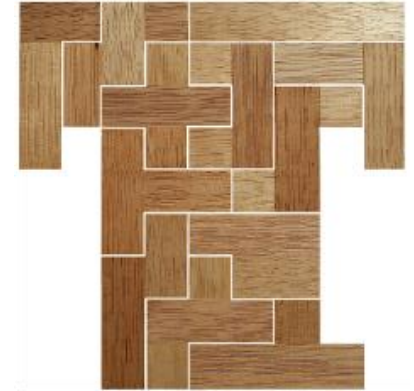
Fig. 20 www.creagenios.com.mx