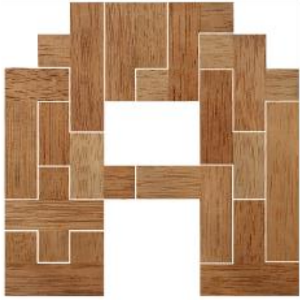
Fig. 1 www.creagenios.com.mx