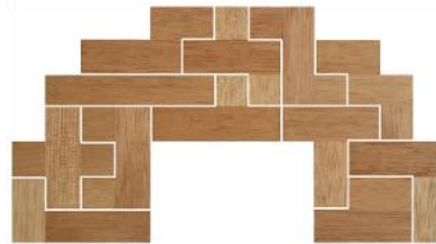
Fig. 47 www.creagenios.com.mx