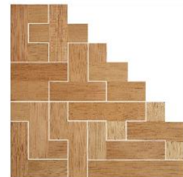
Fig. 56 www.creagenios.com.mx