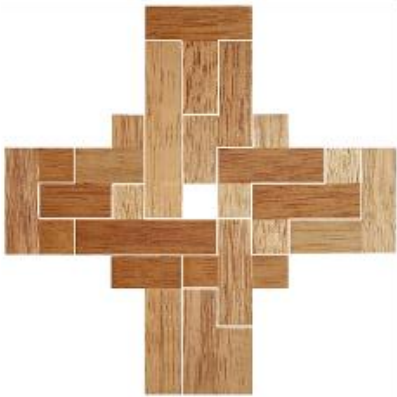
Fig. 45 www.creagenios.com.mx