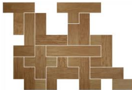
Fig. 67 www.creagenios.com.mx