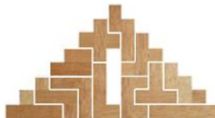
Fig. 55 www.creagenios.com.mx