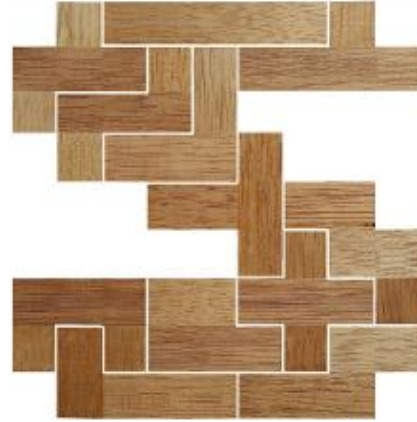
Fig. 19 www.creagenios.com.mx