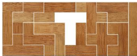
Fig. 107 www.creagenios.com.mx