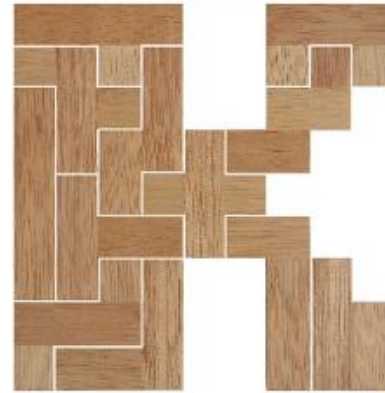
Fig. 11 www.creagenios.com.mx