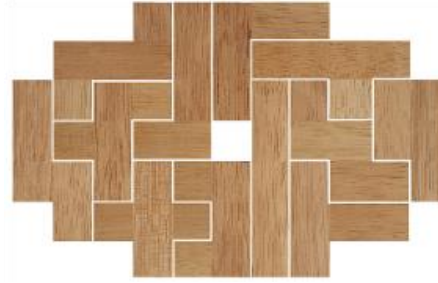
Fig. 59 www.creagenios.com.mx