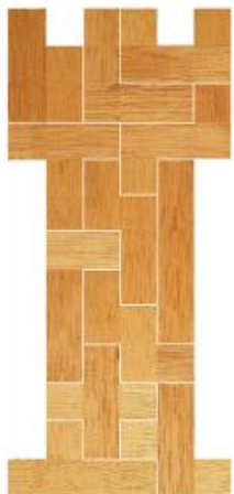
Fig. 65 www.creagenios.com.mx