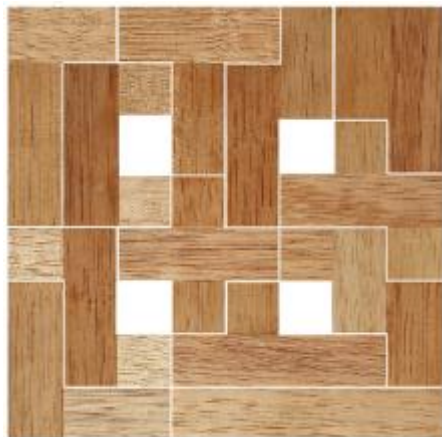
Fig. 82 www.creagenios.com.mx