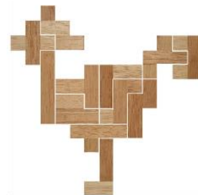
Fig. 32