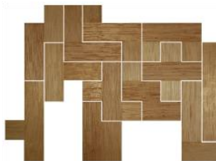
Fig. 31 www.creagenios.com.mx