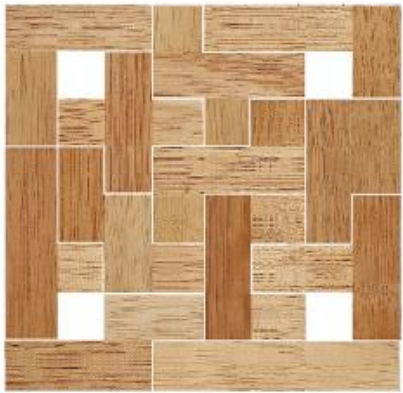
Fig. 77 www.creagenios.com.mx