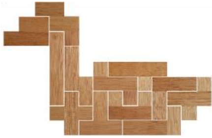
Fig. 33 www.creagenios.com.mx