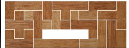
Fig. 104 www.creagenios.com.mx