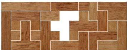
Fig. 105 www.creagenios.com.mx