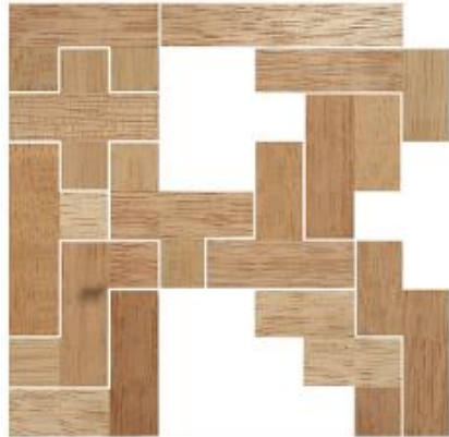
Fig. 18 www.creagenios.com.mx