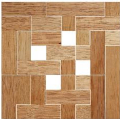
Fig. 81 www.creagenios.com.mx