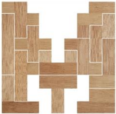
Fig. 13 www.creagenios.com.mx