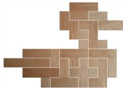
Fig. 39