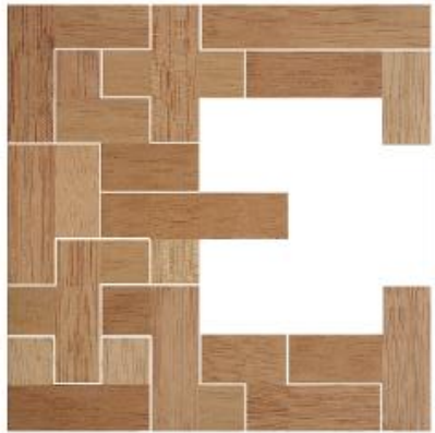
Fig. 5