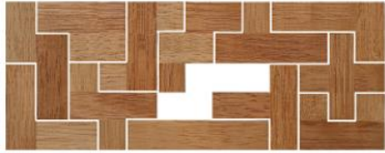
Fig. 97 www.creagenios.com.mx