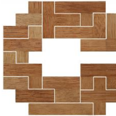
Fig. 3 www.creagenios.com.mx