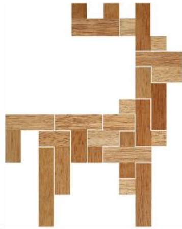
Fig. 42 www.creagenios.com.mx