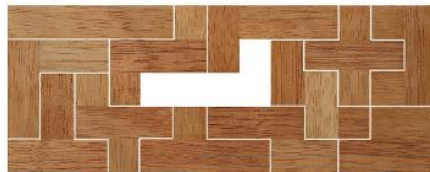
Fig. 102 www.creagenios.com.mx