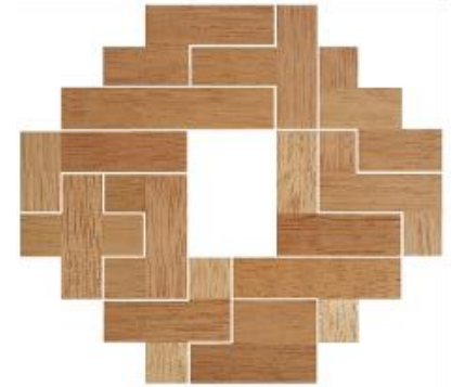
Fig. 60