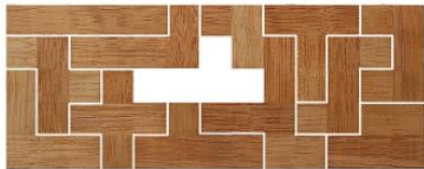
Fig. 101