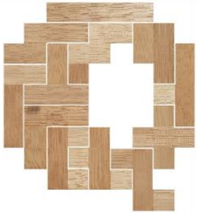
Fig. 17