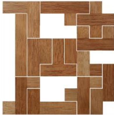
Fig. 2 www.creagenios.com.mx