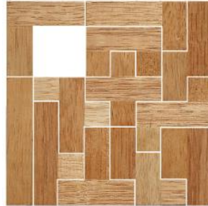
Fig. 79 www.creagenios.com.mx