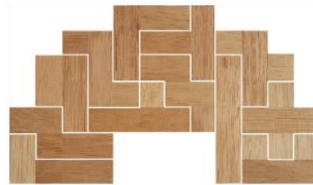
Fig. 63 www.creagenios.com.mx