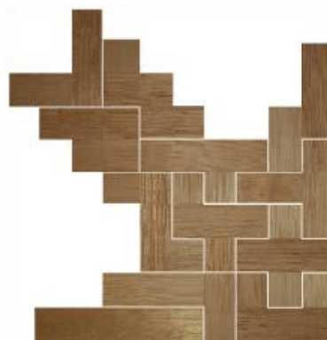
Fig. 51 www.creagenios.com.mx