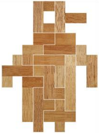
Fig. 41 www.creagenios.com.mx