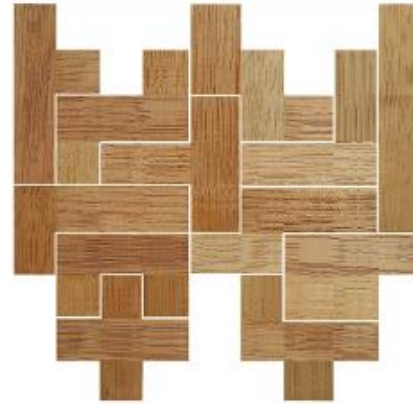
Fig. 23 www.creagenios.com.mx