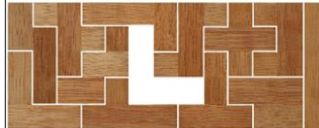
Fig. 103 www.creagenios.com.mx