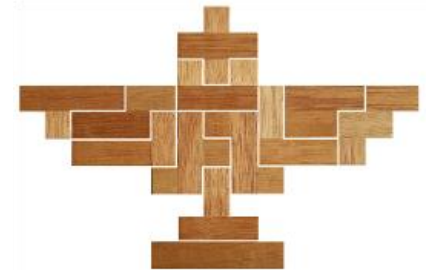
Fig. 48