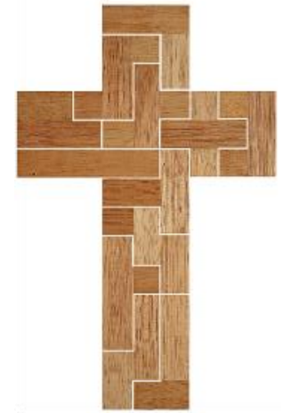
Fig. 44 www.creagenios.com.mx