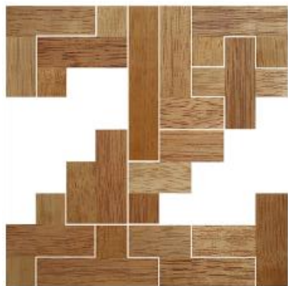
Fig. 26