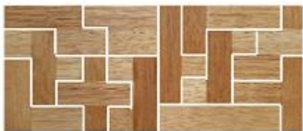
Fig. 69