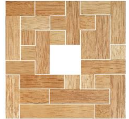
Fig. 76 www.creagenios.com.mx