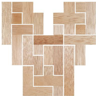
Fig. 25 www.creagenios.com.mx