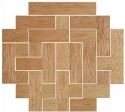
Fig. 61 www.creagenios.com.mx