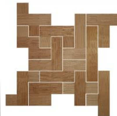
Fig. 52 www.creagenios.com.mx