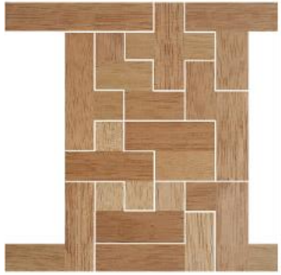
Fig. 9 www.creagenios.com.mx