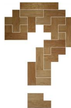
Fig. 68 www.creagenios.com.mx