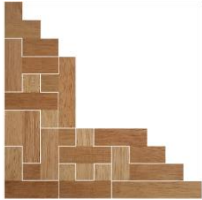
Fig. 58 www.creagenios.com.mx