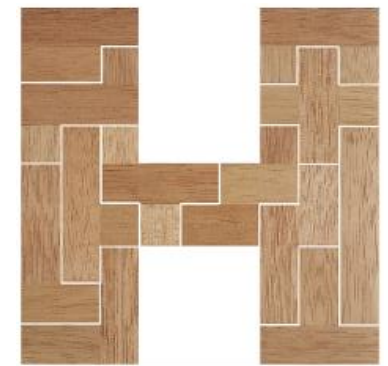
Fig. 8