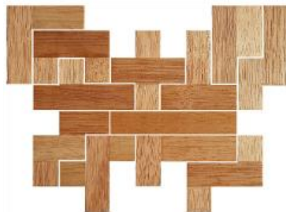
Fig. 38 www.creagenios.com.mx