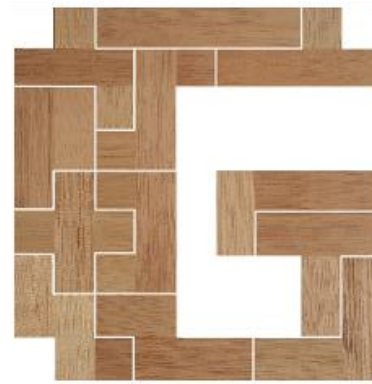
Fig. 7 www.creagenios.com.mx