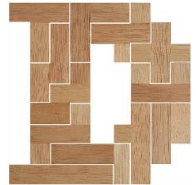
Fig. 4 www.creagenios.com.mx