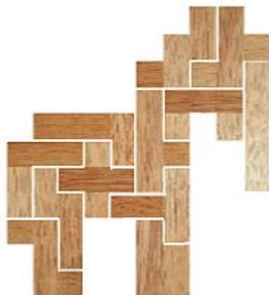
Fig. 30 www.creagenios.com.mx