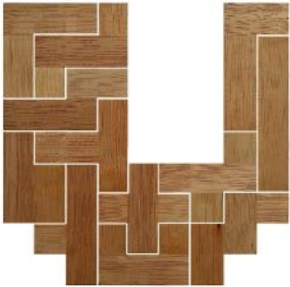
Fig. 21 www.creagenios.com.mx