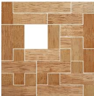
Fig. 83