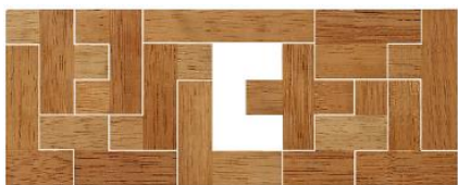
Fig. 106 www.creagenios.com.mx