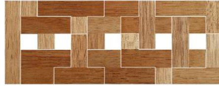
Fig. 75 www.creagenios.com.mx