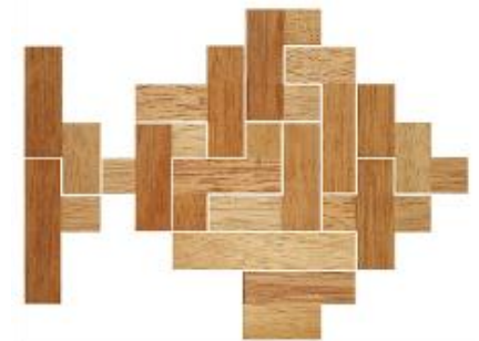
Fig. 40 www.creagenios.com.mx