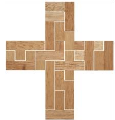
Fig. 64 www.creagenios.com.mx