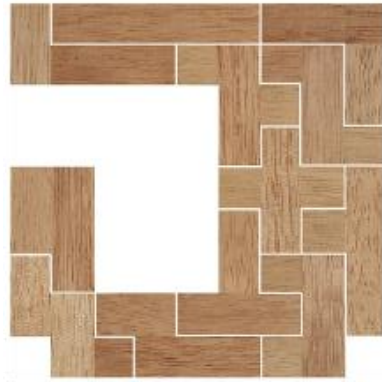
Fig. 10 www.creagenios.com.mx