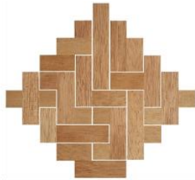
Fig. 46