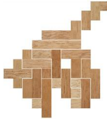
Fig. 43 www.creagenios.com.mx