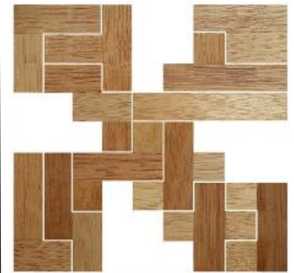
Fig. 24 www.creagenios.com.mx