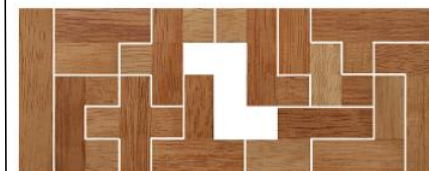
Fig. 96 www.creagenios.com.mx