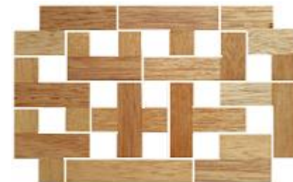
Fig. 72 www.creagenios.com.mx