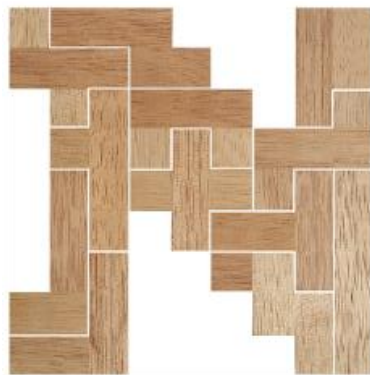
Fig. 14