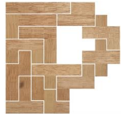
Fig. 16 www.creagenios.com.mx