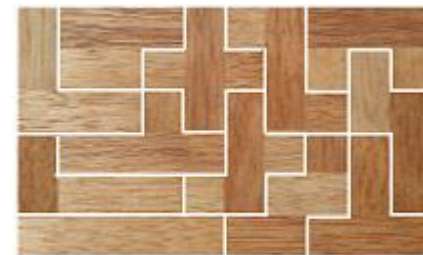
Fig. 108 www.creagenios.com.mx