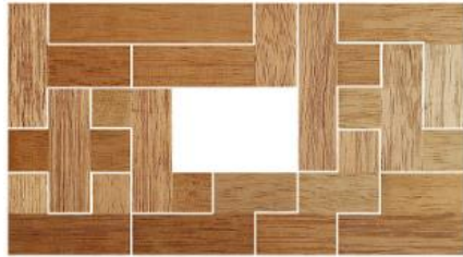
Fig. 74 www.creagenios.com.mx