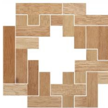
Fig. 15 www.creagenios.com.mx