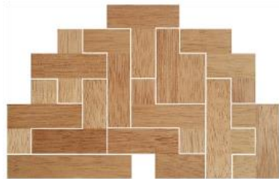
Fig. 62