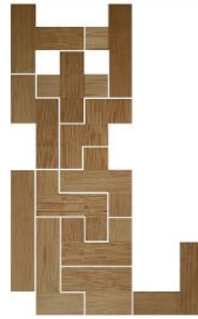
Fig. 35 www.creagenios.com.mx