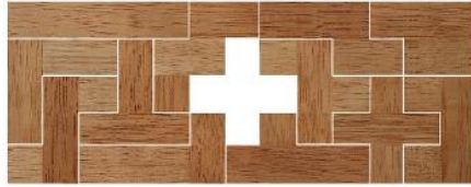
Fig. 98 www.creagenios.com.mx