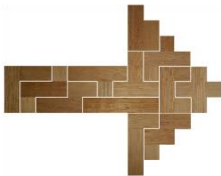
Fig. 66 www.creagenios.com.mx