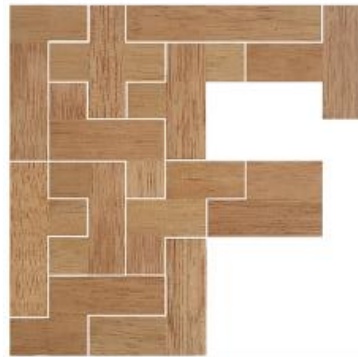
Fig. 6 www.creagenios.com.mx