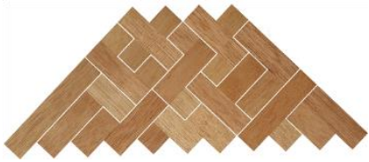
Fig. 57 www.creagenios.com.mx