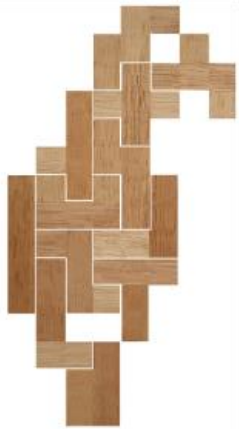
Fig. 37 www.creagenios.com.mx