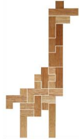
Fig. 36 www.creagenios.com.mx