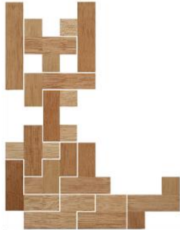
Fig. 34