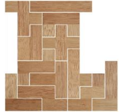
Fig. 12 www.creagenios.com.mx