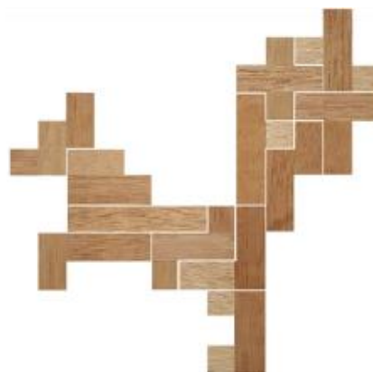
Fig. 27 www.creagenios.com.mx