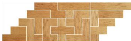
Fig. 53 www.creagenios.com.mx