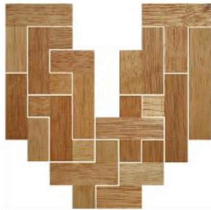
Fig. 22 www.creagenios.com.mx