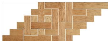
Fig. 54 www.creagenios.com.mx