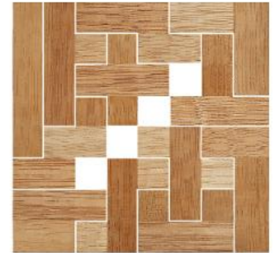
Fig. 80