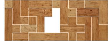
Fig. 100 www.creagenios.com.mx