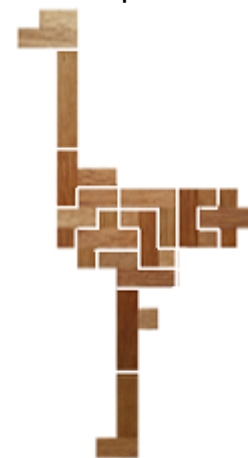
Fig. 28 www.creagenios.com.mx